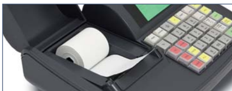
Easy drop af papir